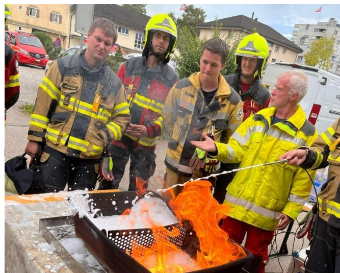
Experimentalvortrag Schaum am Reg. Of-WBK in Uzwil