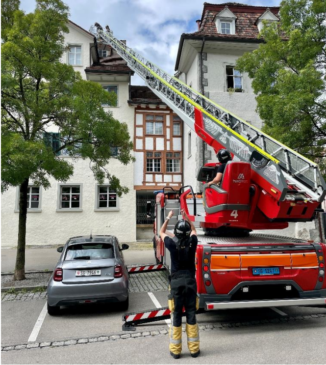
AdL-Training in der Altstadt