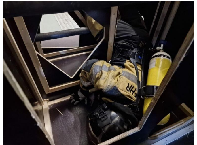
PAFARI - Gegen Atemnot und Platzangst ankämpfen