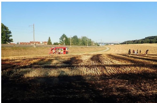
Das betroffene Feld neben dem Bahntrasse

Ausgangslage: Auf einer Fläche von ca. 80 x 60 m hat sich ein Flurbrand (Stoppelfeld) neben dem Bahntrasse entwickelt.