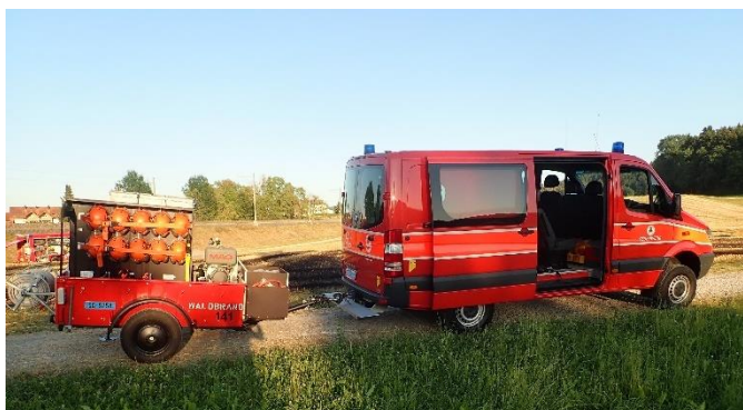
Der Waldbrandanhänger Marke "Eigenbau"

Massnahmen: Es erfolgt eine Absprache mit dem Verantwortlichen der SBB. Mit Druckleitungen und den leichten Leitungen ab Waldbrandanhänger wird der Brand bekämpft bzw. Glutnester gelöscht. Das betroffene Feld wird mit Wärmebildkameras kontrolliert. Bei solchen Bränden wird schnellstmöglich in leichtem Tenue gearbeitet, da die Arbeiten oft langwierig und anstrengend sind. Der Wasserbezug kann je nach Lage ebenfalls herausfordernd sein. In diesem Fall wurde das neue Mittel "Wassertransport leicht" (500m 75er-Leitung auf einem Haspel) angefordert.