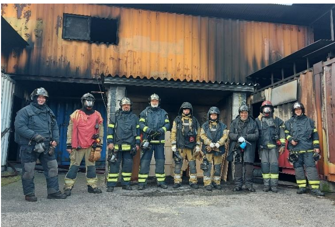
Bunt gemischte Teilnehmer aus dem Wallis, Wil und Deutschland