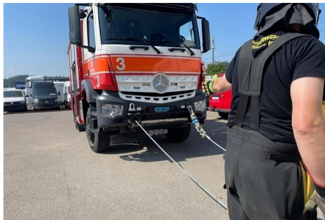
Detailausbildung Seilwinde Rüstwagen G3