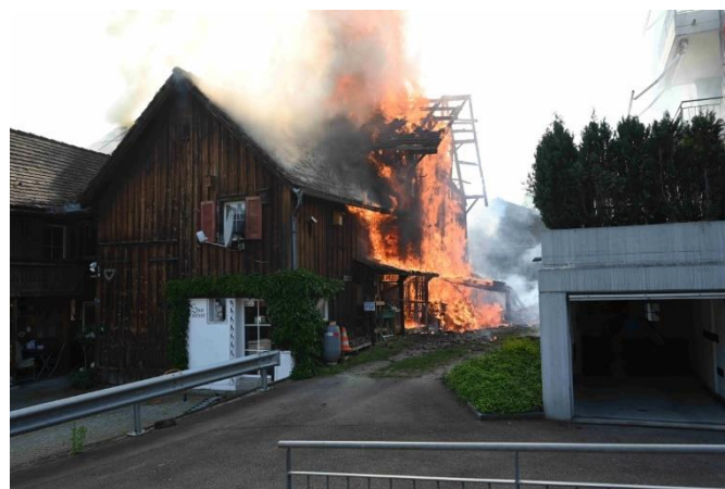
Die Liegenschaft im Vollbrand

Massnahmen: In Absprache mit dem Einsatzleiter der Feuerwehr Region Uzwil wird ein Halteauftrag mit dem Wasserwerfer von der ADL befohlen.