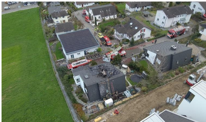
Überblick mittels Drohnenaufnahme

Ausgangslage: Die PV-Anlage auf dem Dach ist in Brand geraten. Die Bewohner stehen glücklicherweise unversehrt vor dem Haus. Der Rettungsdienst und die Polizei sind ebenfalls aufgeboten.