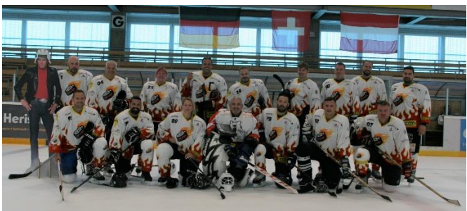
Team "Wil Fire" 2023

Am 10.06.2023 fand zum 6. Mal das Eishockey-Turnier der Blaulichtorganisationen in Herisau statt. Unsere Mixed-Mannschaft "Wil Fire", die mittlerweile vornehmlich aus Feuerwehr- und Polizeiangehörigen besteht, konnte den tollen 4. Schlussrang erzielen. Herzlichen Glückwunsch!