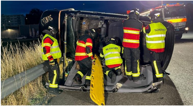
Seitenlage auf Leitplanke

Die Übungen beider Pikettzüge zum Thema Strassenrettung fanden am 19.06. und 26.06.2023 statt. Die Hauptthemen der Übungen waren, Stabilisieren und Unterbauen, Schnitttechnik und Einsatztraining.