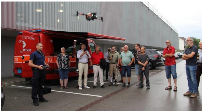
Ehemalige bei der Vorführung der Einsatzdrohne

Im Rahmen der Kp 2 Übung besuchten rund 46 ehemalige Kameradinnen und Kameraden den Übungsbetrieb und liessen sich durch unseren Kommandanten über Neuigkeiten informieren.