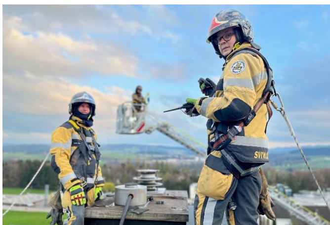
Arbeiten auf dem Dach

In Absprache mit der Gebäudeversicherung wird ein Notdach erstellt. Das Haus kann bewohnbar an den Eigentümer übergeben werden. Der Einsatzleiter führt gegen Mitternacht noch eine Nachkontrolle durch.