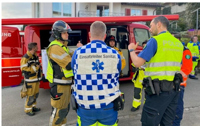
Absprachen Feuerwehr, Sanität und Polizei

Massnahmen: Das Feuer kann mittels Einsatz ab Auto-drehleiter direkt und schnell unter Kontrolle gebracht werden. Die Trennung von Photovoltaikanlage und Wechselrichter hat oberste Priorität. Die betroffenen Panels müssen demontiert und für die Nachkontrolle und den Erkennungsdienst nach unten geschafft werden. Ins Haus läuft nur eine minimste Wassermenge, die Möbel werden abgedeckt und bleiben unversehrt. Die Drohne kann erstmals an einem Einsatz gewinnbringend eingesetzt werden. Es werden drei Abspracherapporte zwischen Polizei, Rettungsdienst, Feuerwehr und Gebäudeversicherung St. Gallen durchgeführt.