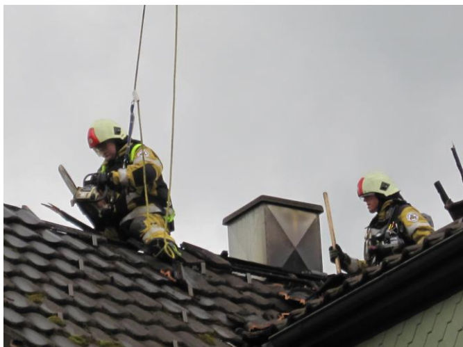
Nachlöscharbeiten mit entsprechender Dachsicherung.

Massnahmen: Die sich im Haus aufhaltenden Personen werden sofort rausgebracht. Mit mehreren Druckleitungen wird der Innenangriff gestartet und ein Übergriff auf die Drechslerei verhindert. Mit der Autodrehleiter wird das Dach abgedeckt, damit die Wärme entweichen kann und ein Löschangriff von oben möglich ist. Das ganze Gebäude wird entraucht. Eine Brandwache bleibt bis zum nächsten Morgen vor Ort.