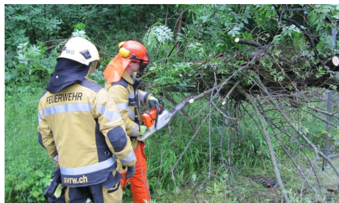
Der Einsatz der Kettensäge erfolgt mit Schnittschutzhose

Massnahmen: Nach Absprache mit der Polizei wird die Strassensicherung erstellt. Zur Sicherheit wird mit dem Tanklöschfahrzeug und dem Rüstwagen ein Block gebildet. Somit sind die Einsatzkräfte durch die Fahrzeuge geschützt. Der Baum wird bis zum Wildzaun zurückgeschnitten und die Fahrbahn gesäubert.