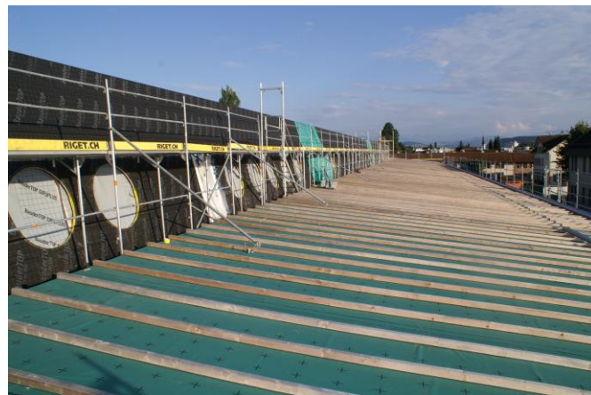
Dachfläche für die Photovoltaikanlage

Raumgestaltung im Obergeschoss ist mit den Vorbereitungsarbeiten für die Gipswände klar ersichtlich.