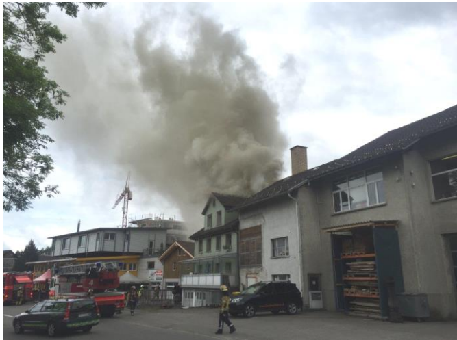
Situation beim Eintreffen der Feuerwehr

Ausgangslage: Beim Eintreffen der Feuerwehr ist Feuer im 2. Stock und eine starke Rauchentwicklung aus dem Dachstock sichtbar. Personen befinden sich noch im Haus.