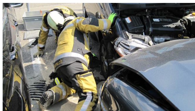
Die Ölwanne wurde aufgeschlitzt

Ausgangslage: Eine Autolenkerin fährt mit ihrem Personenwagen frontal in ein anderes Auto, welches auf dem Parkplatz Friedeck korrekt abgestellt war. Es ist niemand verletzt worden.