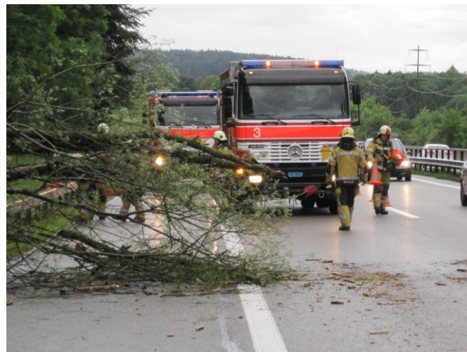
Korrekte Strassensicherung mit RW und TLF

Ausgangslage: Die Polizei ist vor Ort. Infolge eines Sturmes ist ein Baum über den Wildzaun gestürzt und ragt in die Autobahn. Die rechte Fahrspur ist bereits gesperrt.