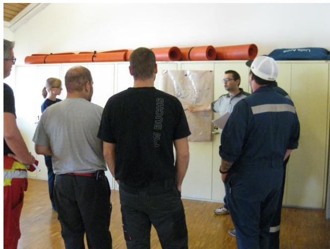
Die erstellten Lageskizzen werden besprochen

Ziel des kantonalen Kurses war, dass jede Teilnehmerin und jeder Teilnehmer die Einsatzleitung in verschiedensten Einsätzen der Feuerwehr gezielt unterstützen kann. Das am Kurs erworbene Wissen ist das Fundament für die weitere Ausbildung. Diese Festigung obliegt dann den einzelnen Feuerwehren.