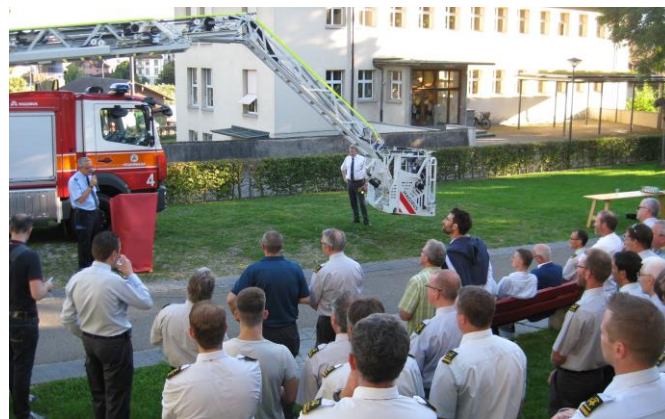
Offizielle ADL Übernahme hinter dem Depot

Mit einem Monat Verspätung übernahmen wir Ende Juli die neue Autodrehleiter (ADL) G4. Ein tolles Gerät mit neuen Funktionen wie dem Gelenkteil, dem grossen Korb, der Schachtfunktion oder der Möglichkeit, Bewegungsabläufe aufzuzeichnen und diese selbständig ausführen zu lassen.