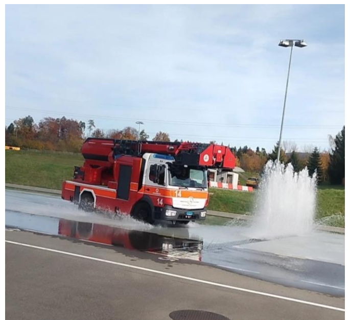
ADL G14 auf der Trainingsstrecke

Das jährliche Fahrsicherheitstraining wurde mit G12, G13, G14 und G16 absolviert. Die Maschinisten kommen im Turnus dazu, mit den zugewiesenen Fahrzeugen in sicherer Umgebung an die Grenzen zu gehen und ihre Fahrer-Skills zu festigen.