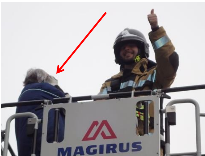
Katzenrettung erfolgreich ausgeführt – alle happy ☺!

Ausgangslage: Gemäss Anruferin hat die Katze über einen parkierten LKW das Gebäudedach erreicht und kommt nun alleine nicht mehr runter.