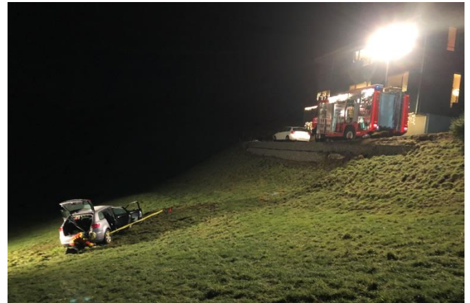
Personenwagen nach Selbstunfall in Wiesenbord

Massnahmen: Mit dem Einsatzleiter der Feuerwehr Kirchberg-Lütisburg wird Rücksprache gehalten. Ab dem Rüstwagen G3 wird die Beleuchtung und die hydraulischen Rettungsgeräte bereitgestellt und das Fahrzeug unterbaut. Zur Dachentfernung kommt es nicht mehr, da der Notarzt der Rega einen Rapid Exit anordnet.