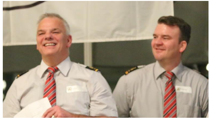
Frisch zum Major und Hauptmann befördert

>> allen Beförderten Herzlichen Glückwunsch!