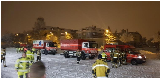
Sammlung beim FW-Depot Gossau zur Rückfahrt

Ausgangslage: Nach einem Lawinenniedergang auf der Schwägälp sind Schneemassen teilweise in Räumlichkeiten des Hotels eingedrungen. Es mussten Personen evakuiert werden und auch die Anzahl der Vermissten war anfangs noch unklar. Der Einsatzleiter Sanität vor Ort hat die Sanitätshilfsstelle angefordert. Dies ist die erste Echt-Alarmmeldung dieser Stufe für uns.