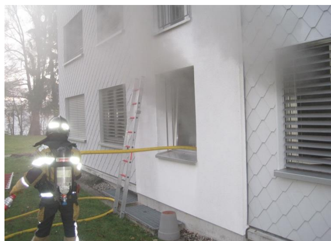
Zugang zur Wohnung über ein gekipptes Fenster

Donnerstag, 6. Dezember 2018, 1612 Uhr: FW Bronschhofen, Wohnungsbrand, Eggwilstrasse 2B, Alst 1.1