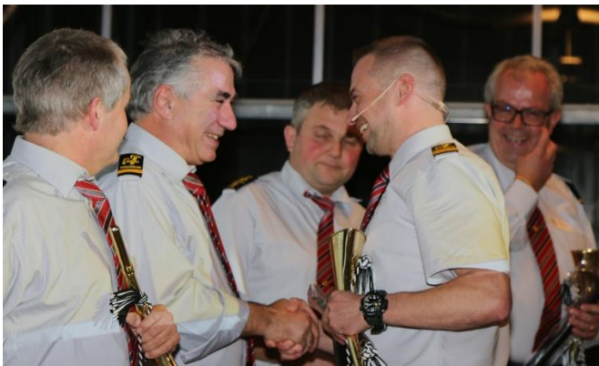
Für langjährige Dienste geehrt und verabschiedet