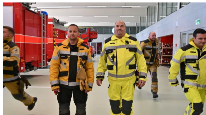
Ausschnitt aus dem Werbefilm auf hallowil.ch

Trotz der angespannten Situation in der Öffentlichkeit konnten wir aber bei der Rekrutierung neuer Feuerwehrangehöriger ein positives Ergebnis verzeichnen. Mit diversen Werbemassnahmen wie Plakaten an den Strassen, Auftritten in den sozialen Medien und der Anschrift von Neuzuzüglern erreichen wir jeweils viele Interessierte. Dieses Jahr haben wir unseren Fokus vor allem auf die Sanitätszüge gerichtet, da wir in dieser Formation dringend guten und motivierten Nachwuchs brauchen. Deshalb wurde auch der Werbefilm auf www.hallowil.ch speziell auf die Sanitätszüge der Feuerwehr ausgelegt. Die Massnahmen haben insofern Wirkung gezeigt, dass wir von nun insgesamt elf neuen AdF vier Einteilungen in die Kompanie 3 vornehmen können.