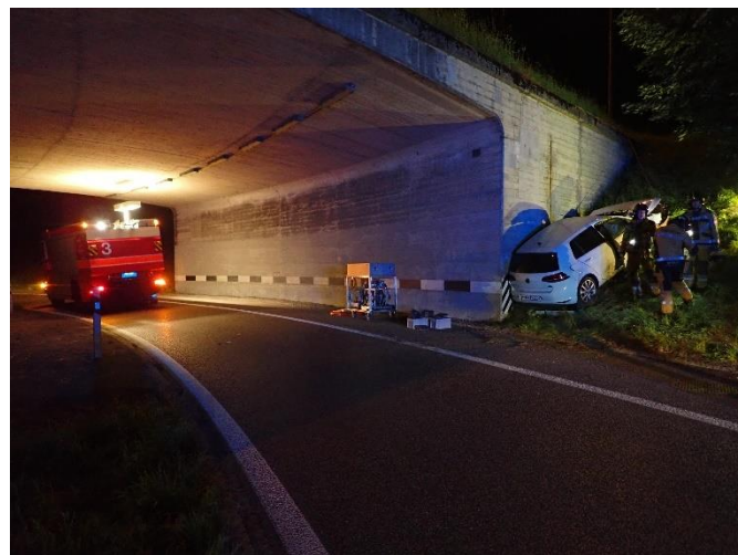
An der Unterführungswand gebremst

Ausgangslage: Polizei und Rettungsdienst sind bereits vor Ort. Das Unfallfahrzeug ist wohl von der Fahrbahn abgekommen, mit einer Strassenlaterne und Leitpfosten kollidiert und dann in die rechte Seite der Unterführungswand geprallt, wo es zum Stillstand gekommen ist.