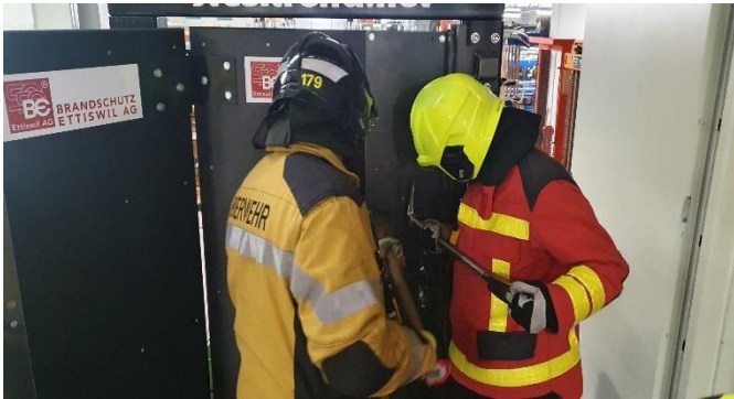
Gewaltsame Türöffnung im Feuerwehrdienst

Am 26. September 2020 wurde in Wil der Regionale AdF1-Refresherkurs für die neuen AdF 2020 des Regionalverbandes durchgeführt. Der Kurs wurde aufgrund der Ausbildungslücke der neuen AdF durch den Lock-down ins Leben gerufen und beinhaltete v.a. Themen der Basisausbildung aber auch Horzonerweiterndes wie etwa die gewaltsame Türöffnung im Feuerwehrdienst.