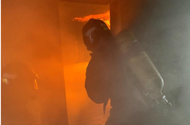
Erfahrungen beim Vorgehen Kellerbrand

Am 15. August 2020 wurden die neuen AdF 2020 an einem Atemschutz-Halbtage im Ausbildungszentrum Andelfingen im Bereich Innenbrandbekämpfung geschult. Nach der Demo in der Rauchdurchzündungsanlage konnten die Teilnehmer an zwei verschiedenen Posten trainieren und Erfahrungen sammeln.