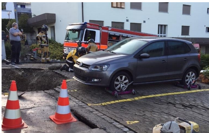
Das Fahrzeug wird gesichert verschoben.

Ausgangslage: Bei einem Wasserrohrbruch in derselben Nacht, zu dem die Feuerwehr bereits aufgeboten war, ist eine grosse Menge Wasser über den Parkplatz und in eine Tiefgarage geflossen. Die Dorfkorporation hatte den Einsatz übernommen; durch die Feuerwehr waren keine Massnahmen notwendig. In den frühen Morgenstunden wird aber bemerkt, dass ein Personenwagen in die entstandene Grube einzubrechen droht.