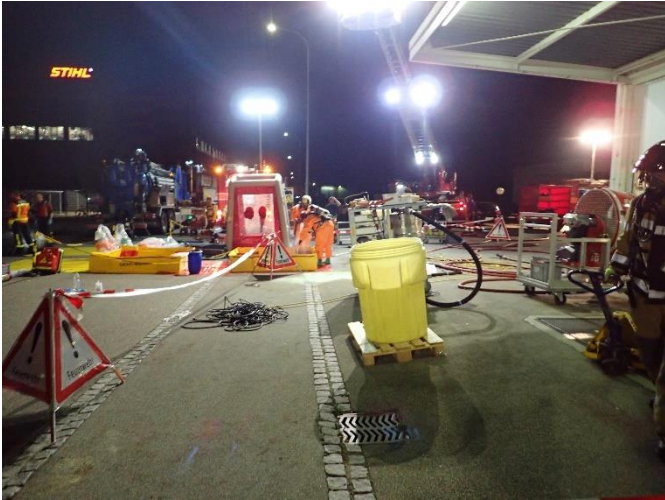
ABC-Einsätze sind personal-, material- und zeitintensiv.

Massnahmen: Nach der Stofferkennung und Lagebeurteilung wird der Chemiewehrstützpunkt St. Gallen aufgebildet. Es wird die Absperrung mit Ein- und Ausgang, der Brandschutz und der Führungsstandard erstellt und besetzt. Nach Eintreffen der Chemiewehr wird diese in verschiedenen Bereichen unterstützt. Für die Entsorgung des Havariegutes und für die Lieferung von Sand werden externe Firmen beigezogen. Ausserdem wird das AFU informiert. Der Einsatz inklusive Retablierung zieht sich bis in die Nacht.