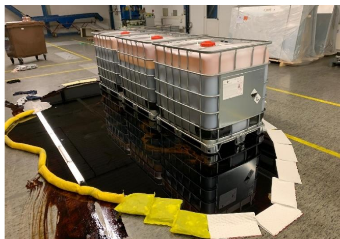
Ausgelaufenes Medium in der Lagerhalle

Ausgangslage: In einer Lagerhalle sind ca. 100 Liter Chromiumsäure aus einem Gebinde ausgelaufen. Der Sicherheitsverantwortliche der Firma ist vor Ort, es befinden sich keine Personen mehr im Gefahrenbereich. Das Medium wurde bereits behelfsmässig eingedämmt. Gemäss Gefahrensymbolen wird das Medium als ätzend, korrosiv, gesundheitsschädigend, gewässergefährdend und hochgiftig eingestuft.