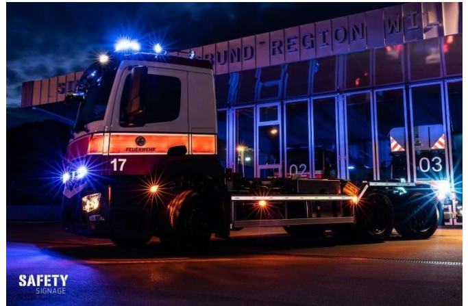
Neues Wechselträgerfahrzeug

Weiteres Kleinmaterial und Anpassungen im Magazin wurden im Newsletter 2/2020 erwähnt.