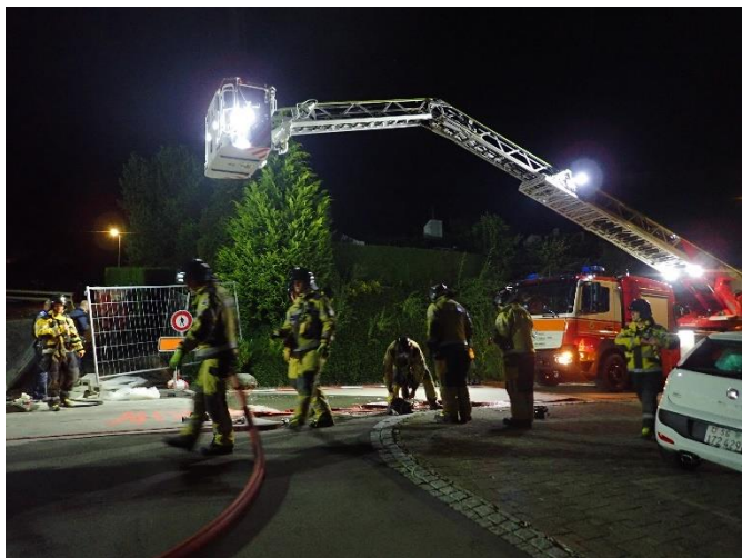
Beleuchtung Schadenplatz für Spurensicherung

Ausgangslage: Eine Baustellentoilette und eine Holzpalette brennen, die Hecke der Nachbarparzelle hat ebenfalls Feuer gefangen. Die Strasse ist mit Schriftzügen versprayt. Es muss von Brandstiftung ausgegangen werden.