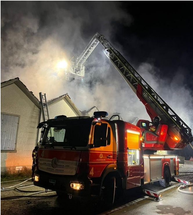
Unsere ADL im Einsatz in Münchwilen

Bilder der Drohne für die Einsatzleitung sehr wertvoll und unterstützend.