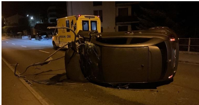
Selbstunfall mit grossem Schaden

Ausgangslage: Selbstunfall mit einem Fahrzeug. Der Lenker ist mit seinem Auto mit einem Metallzaun kollidiert und hat Teile davon aus den Verankerungen gerissen. Der Rettungsdienst und die Polizei sind vor Ort. Der Lenker wird bereits medizinisch versorgt.