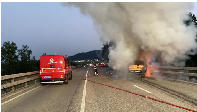
Die Fahrbahnen mussten gesperrt werden

Ausgangslage: Ein Fahrzeug ist auf dem Autobahnzubringer in Brand geraten. Bei Ankunft der ersten Fahrzeuge steht das Auto bereits in Vollbrand.