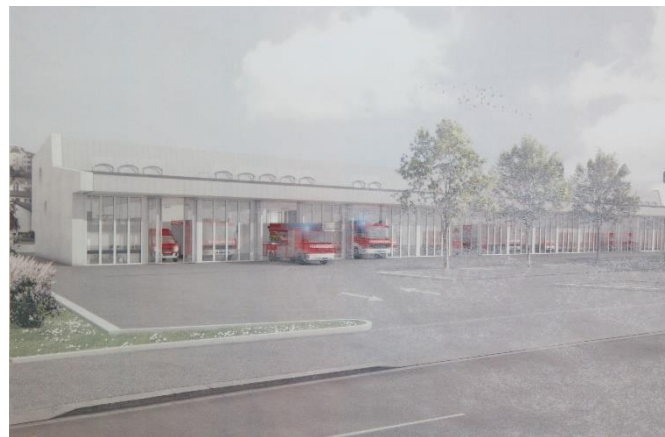
Damals: Zeichnung zum Vorschlag neues Depot

Ein Blick zurück zeigt ebenfalls, wie schnell die Zeit vergeht: Im August 2015 war der Spatenstich für unser Depot. Heute ist es für uns selbstverständlich, aber bleibt ein Meilenstein in unserer Entwicklung. Infrastruktur allein macht zwar keine Feuerwehr – aber sie schafft die Basis, dass Ausbildung, Logistik und Einsätze professionell laufen. Gut, sich daran zu erinnern und dankbar zu sein – wir haben ein wirklich tolles Feuerwehrdepot, das auch gerne von anderen Feuerwehren besucht wird, die sich mit der Planung eines neuen Gebäudes beschäftigen.