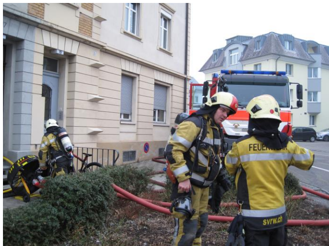
Absprache mit Einsatzleiter

Ausgangslage: Beim Eintreffen des Einsatzleiters ist im Treppenhaus Rauchgeruch wahrnehmbar. Die Türe zur Wohnung im 1. Obergeschoss ist verschlossen. Gemäss Aussagen der Anruferin haben die Mieter der Wohnung am Morgen das Haus verlassen.