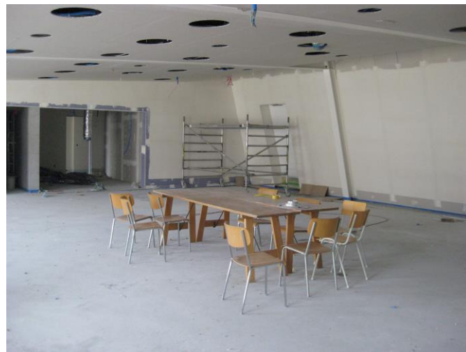
Schulungsraum mit Office

In vier Monaten, also noch vor den Sommerferien, sind wir ins Betriebsgebäude eingezogen. Der Umzug der Feuerwehr wird an einem Freitagabend erfolgen. Noch offen ist, welcher Freitag dies sein wird. Zu gegebener Zeit erhalten alle Feuerwehrangehörigen ein zeitlich gestaffeltes Aufgebot. Jede und jeder wird seine Einsatz-ausrüstung selber in die neue Garderobe hängen. Beim anschliessenden Imbiss kann das neue Domizil des Sicherheitsverbundes Region Wil erkundet werden.