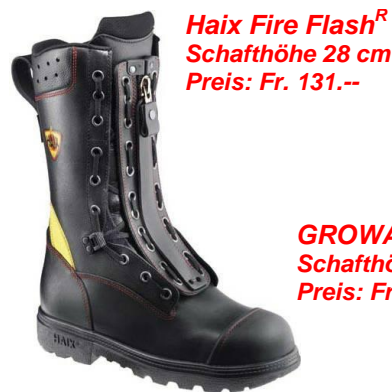
Haix Fire Flash R Schafthöhe 28 cm Preis: Fr. 131.--