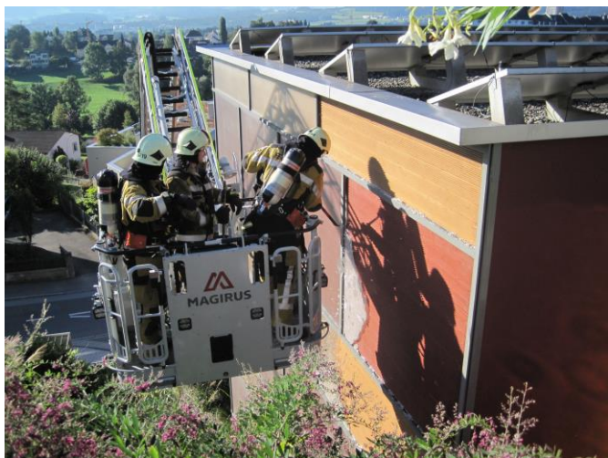
Die Fassade muss geöffnet werden.

Ausgangslage: Bei Alarmeingang ist die Feuerwehr Region Wil wegen einer Brandmeldeanlage im Hotel Freihof in Wil bereits im Einsatz. Die Mannschaft und Mittel können jedoch abgezogen werden. In einem solchen Fall ist es wichtig, dass der Standort der Einsatzzentrale gemeldet wird und dessen Anweisungen befolgt werden. Die Ausrückreihenfolge wird eingehalten. Beim Eintreffen der Feuerwehr steht ein Teil der Fassade in Brand.