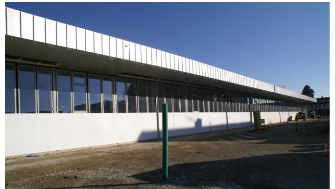
Aussenansicht Richtung Tore

Leider hat die angekündigte Terminumfrage für die Besichtigung des Betriebsgebäudes nicht stattgefunden. Diese wird im neuen Jahr nachgeholt. Die Photovoltaik-Paneele liegen seit Oktober auf dem vorderen Dach.