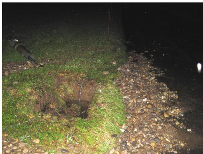
Das Wasser hat Erde und Kies ausgeschwemmt.

Ausgangslage: Ein Lastwagen hat einen Hydranten umgefahren und das Wasser strömt auf die Strasse. Die Polizei trifft kurze Zeit später auch ein.