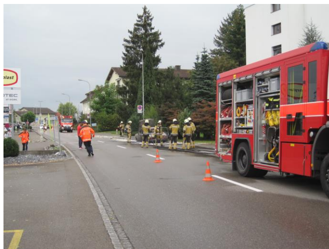
Schadenplatzorganisation, TLF vorne, RW hinten

Ausgangslage: Die Polizei ist bereits vor Ort. Beim Eintreffen der Feuerwehr steht das Fahrzeug auf dem Trottoir in Vollbrand. Es befinden sich keine Personen mehr im Auto.