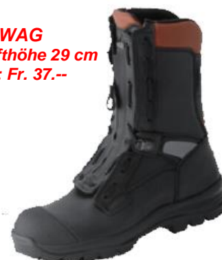
GROWAG Schafthöhe 29 cm Preis: Fr. 37.--

Der Technische Dienst hat einen Grössensatz für die Anprobe bereit. Interessierte können gerne bis zum 6. Januar 2017 vorbeikommen und die Modelle anprobieren. Im Anschluss wird die Bestellung ausgelöst. Bei Fragen steht euch Ruedi Kull gerne zur Verfügung.