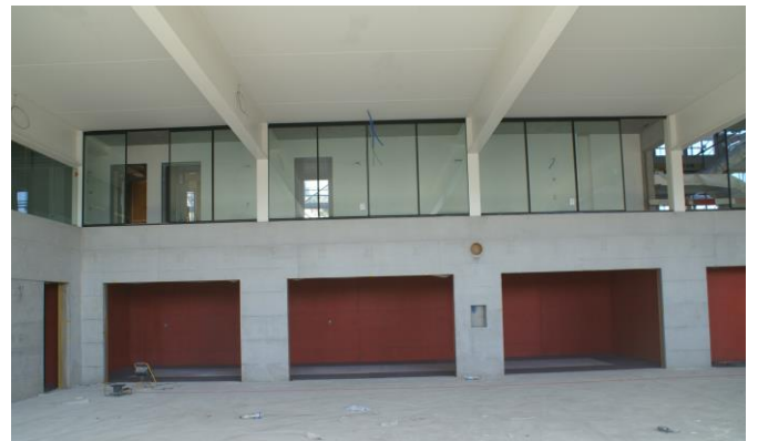
Ansicht Fahrzeughalle Richtung Garderoben

Mittlerweile konnte auch das hintere Dach mit der östlichen Dachrinne dicht gemacht werden. Unter Beizug eines Sachverständigen war es möglich, mit den beteiligten Firmen eine zweckmässige Dachentwässerung zu realisieren. Der Innenausbau kommt zügig voran. Im Juni 2017 ziehen wir ins neue Gebäude ein. Der Tag für die Bevölkerung findet am Samstag, 2. September 2017 statt.