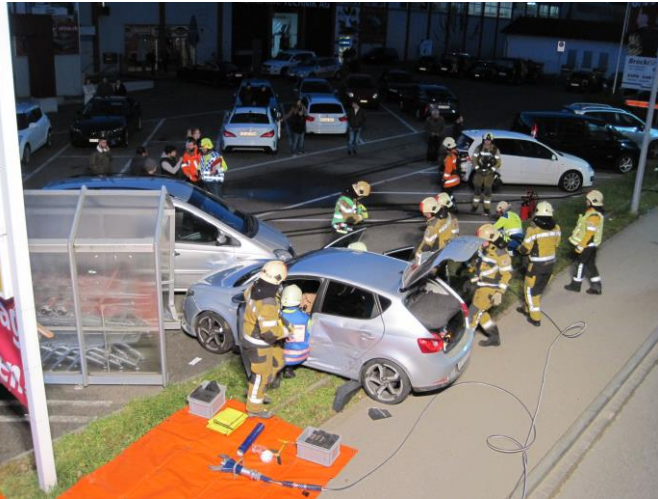
Feuerwehr, Rettung und Polizei beim Einsatz

Ausgangslage: Rettungsdienst und Polizei vor Ort, 3 Patienten werden durch die Rettung betreut. Eine Person ist noch im Fahrzeug.