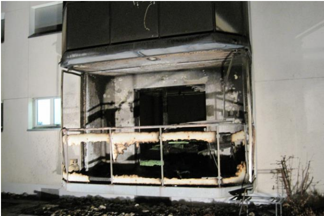
Der ausgebrannte Balkon nach dem Löscheinsatz

Ausgangslage: Offenes Feuer auf einem Balkon im EG. Die Balkontüre und Fenster sind bereits geborsten. Löschversuche von Anwohnern blieben erfolglos. Diverse Bewohner befinden sich im Freien.