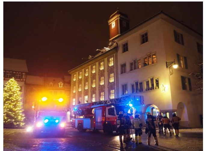
Alarmübung vor weihnachtlicher Kulisse

Mittwoch, 3. Januar 2018, 1014 Uhr: FW Wil, Baum auf Fahrzeug, Klausenstrasse, Alst 0.2