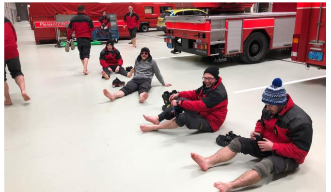
Die kalten Füsse werden im Depot aufgewärmt