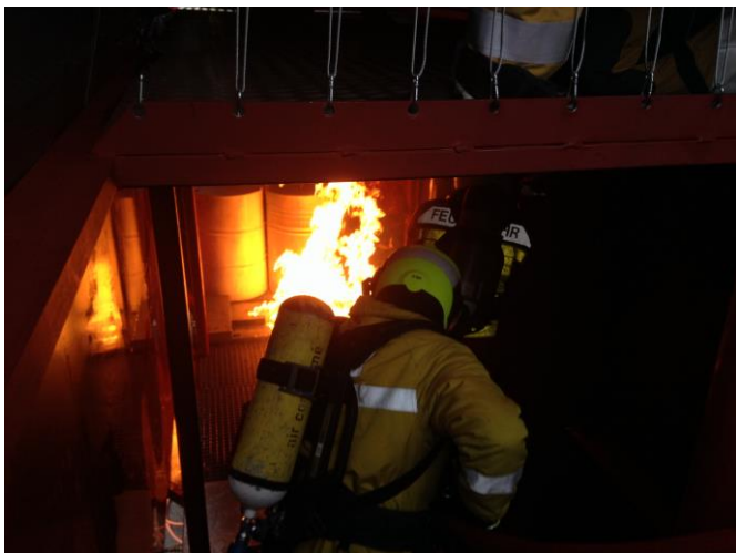
Brandcontainer im Schulungseinsatz

kurz über die Schwerpunkt und Ziele in der Ausbildung informieren. Es finden auch dieses Jahr Halbtagesübungen statt. Für gewisse Themen ist eine Abendübung halt einfach zu kurz. Deshalb bin ich überzeugt, dass es richtig ist, Halbtagesübungen durchzuführen. So wird wieder der Welab San sowie ein Teil der Atemschutzausbildung an Halbtagesübungen geschult. Damit wir das Training am Feuer weiterführen können, wird der Brandcontainer in die Ausbildung integriert. Weitere Schwergewichtsthemen sind die ABC-Wehr und das Atemschutznotfalltraining.