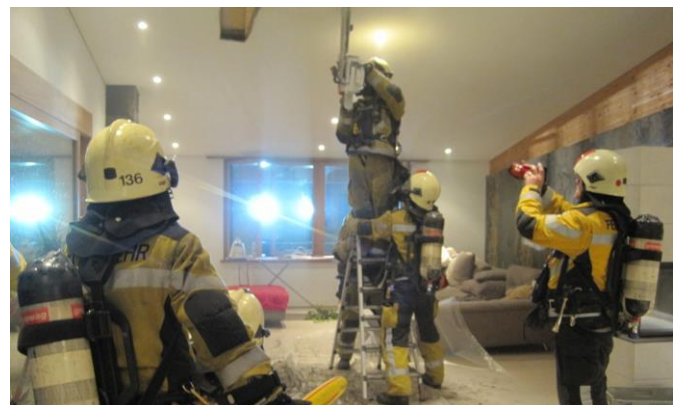
Öffnung des Unterdaches mit Rettungssäge

Ausgangslage: Die Feuerwehr wird durch den Eigentümer eingewiesen. Im Wohnzimmer 1. OG ist es zu einer Rauchentwicklung gekommen, Brandspuren an der Decke sind sichtbar.