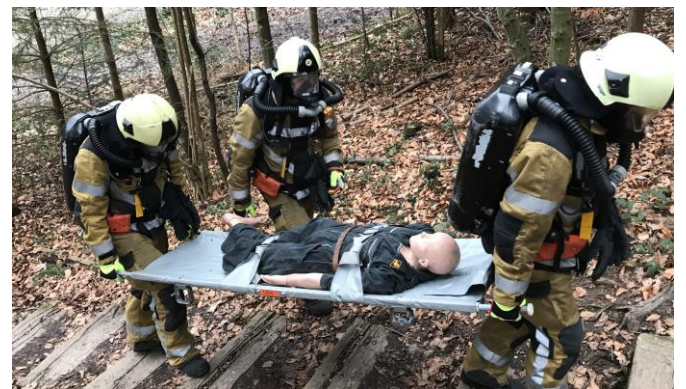
Angewöhnung an das BG4-Gerät