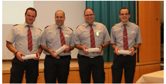
Die 4 frisch beförderten Oberleutnants

Im Grad Wachtmeister zugezogen ist Beat Däscher.