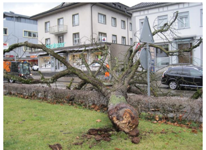
Umgestürzter Baum in der Allee

Ausgangslage: Das Sturmtief „Burglind“ beschert der Region einige Einsätze betreffend umgestürzter Bäume, abgedeckter Dächer und einsturzgefährdeter Baugerüste. Insgesamt erreichen die Feuerwehr Region Wil 11 Alarmmeldungen. Der Einsatz dauert bis in die Nachmittagsstunden.