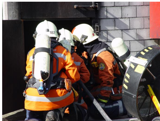
Die Ausbildung im Brandhaus steht ihnen noch bevor.

Am 21. Oktober 2014 fand der Informationsabend für Neueingeteilte der Feuerwehr Region Wil statt. Bis zum Anmeldeschluss anfangs November erklärten 16 Personen den Beitritt zur Feuerwehr Region Wil. Dabei handelt es sich um Empfehlungen von Kameradinnen und Kameraden, Neuzuzüger sowie Personen, welche über unsere Homepage Kontakt aufgenommen haben.