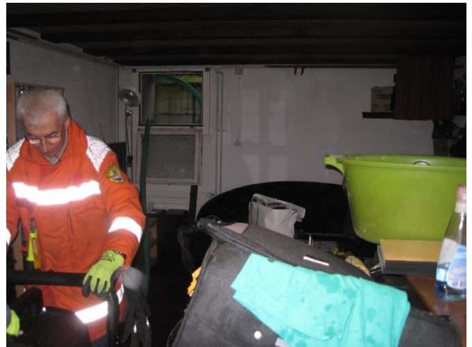
Das Wasser wird mit einem Wassersauger aufgenommen.

Ausgangslage: Infolge eines defekten Wasserhahns läuft Wasser in den Keller. Der Geschäftsführer der Dorfkorporation Bronschhofen ist vor Ort und daran, einen Wasserhahn auszuwechseln.