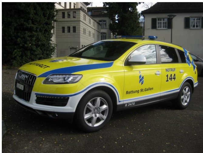
Neues Not-Arzt-Einsatzfahrzeug NEF

Seit Mitte 2005 stellen Angehörige der Sanitäts/Verkehrszüge sowie Mitarbeitende der Geschäftsstelle den Fahrdienst für Anästhesiefachkraft/Notarzt sicher. Dabei wird der Notarzt parallel zum Rettungswagen an den Einsatzort gefahren. Neben dem sicheren Transport zum Einsatzort gehört die Unterstützung des Rettungsteams bei der Notfallversorgung zu den Aufgaben. Mit dem Zusammenschluss der Rettungsdienste Fürstenland-Toggenburg, St. Gallen und Rheintal zur Rettung St. Gallen, hat sich die Aufgabe erweitert. Ab 2013 erhöhte sich dadurch die Zahl der Alarmierungen und wird mit rund 720 Einsätzen in diesem Jahr einen neuen Höchststand erreichen.