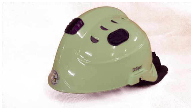
Der neue Dräger HPS 3100

Bei der Beschaffung des neuen Helms für die Kp 3 wurde auf das Erscheinungsbild, Tragkomfort und die Funktionalität geachtet. Der Dräger HPS 3100 ist auf den Seiten höher geschnitten, somit sind die Ohren frei. Mit dem Nackenschutz bietet der Helm auch bei nassem Wetter einen Schutz. Für den Augenschutz steht eine Schutzbrille in einem Etui zur Verfügung.